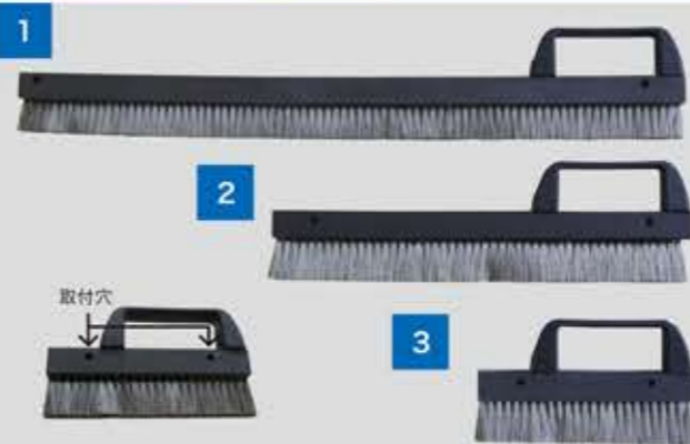
ブラシ毛材:サンダーロン(毛材説明:カタログP14参照) ブラシ台部:MC501CDR2(導電グレード)