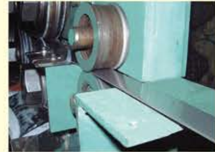
平板コイル材がCH成型機でU字型のチャンネル(CH)を成型します。