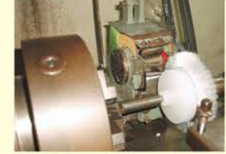
毛刈旋盤でブラシ外径を整えます。