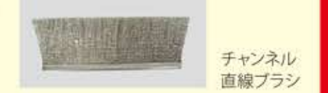
チャンネル直線ブラシ

チャンネルブラシは… チャンネル(CH)と呼ばれる、U字型の金属にブラシ毛材を二つ折れにし、芯線で押さえ込み、チャンネル上部をすぼめて毛材を抜けないようにしてあります。