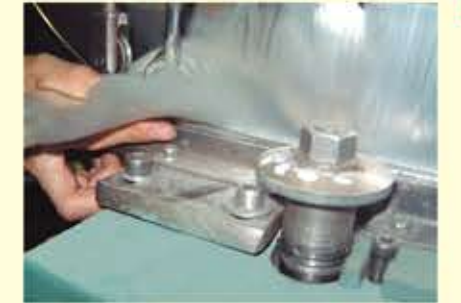
チャンネル材に挿入した毛材を、芯線で固定します。毛材が二つ折れになり直線ブラシができます。