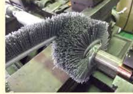
直線ブラシを、巻き取り旋盤でブラシ軸に巻きつけてロールブラシを製作します。